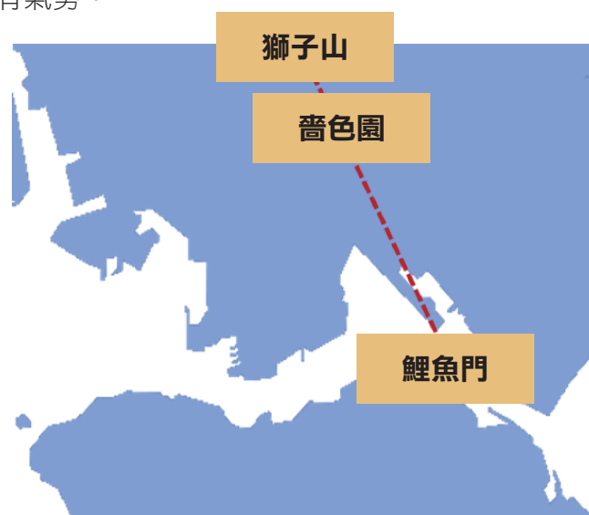
粉紅色虛線是 1921 年黃大仙祠中軸線的坐向 36

當時所謂「鳳翼吉地」，即嗇色園現址也。它位於九龍竹園村 35 後面是獅子山，前面是大片農地，迎向鯉魚門水域。坐北向南，甚有氣勢。