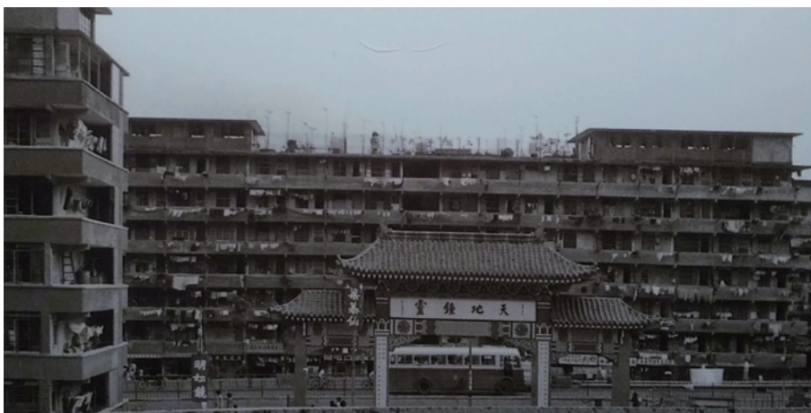
1960年代，黃大仙上下邨已建成，當時黃大仙祠所建的入口牌樓 37

1921年黃大仙祠的山門在大殿南方（因應地理環境稍有調整，軸線並非由正北向正南），粉紅色虛線是當時的中軸線。這平面圖上很多建設，都是後來加建的，詳見以下各章節。