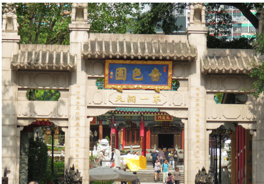
山門：「齋色園（第一洞天）」牌樓

黃大仙祠的「山門」原在大殿的南方，面向村落，迎迓信眾。及後香港發展，滄海桑田，「山門」前的位置成為了貫通東西九龍的幹線公路（龍翔道）。為了行人安全，並配合黃大仙地鐵站的建設，入口已改到現在的「齋色園（第一洞天）」牌樓。